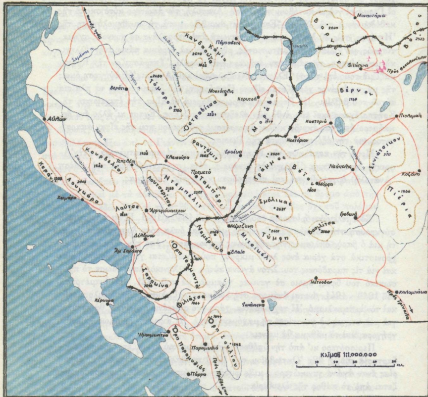
Σημ. Οδικόν δίκτυον ως ήτο την 28 Οκτωβρίου 1940